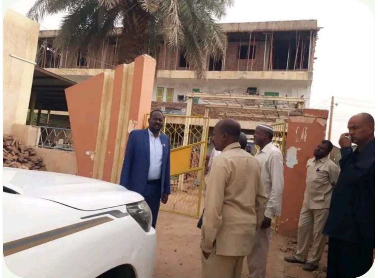
زيارة السيد مدير عام السكة حديد للمركز