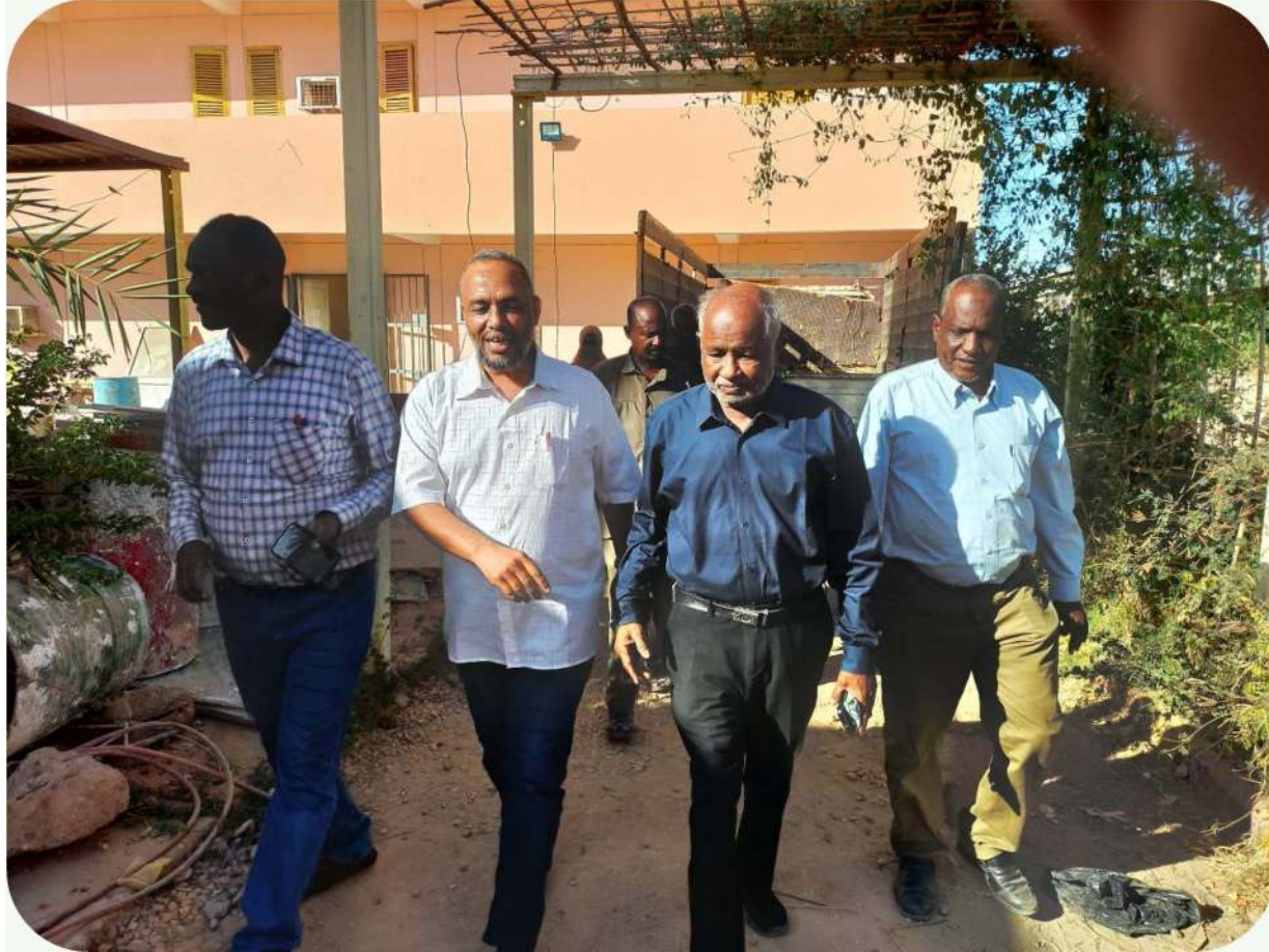
زيارة السيد وزير الصحة الاتحادي للمركز