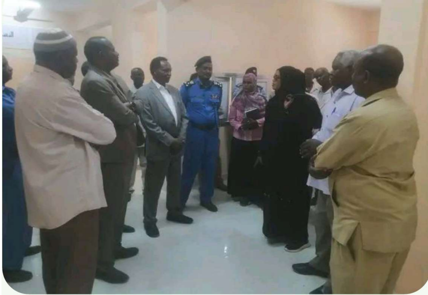
زيارة السيد وزير النقل للمركز