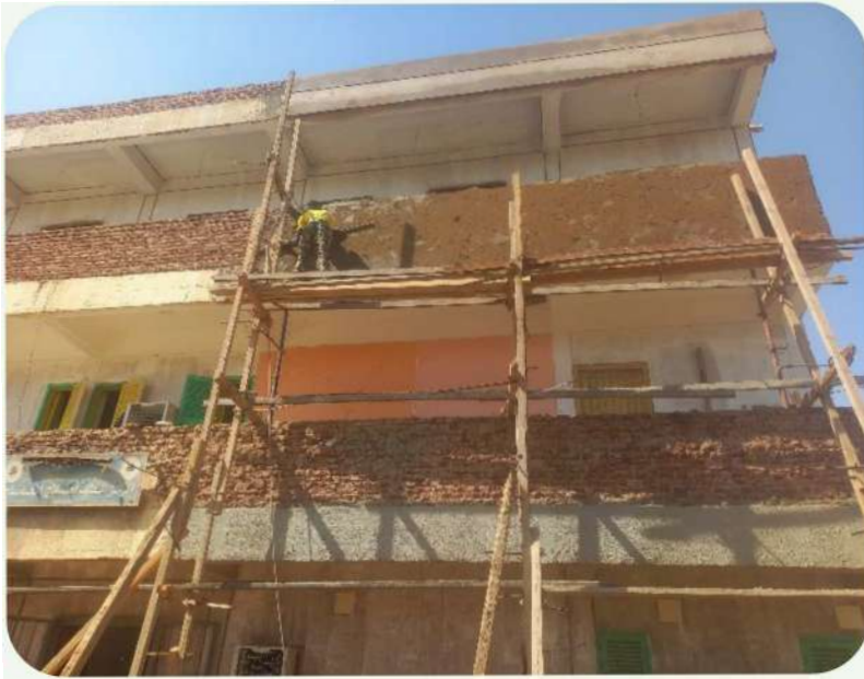
اعمال تقفيل البلكونات