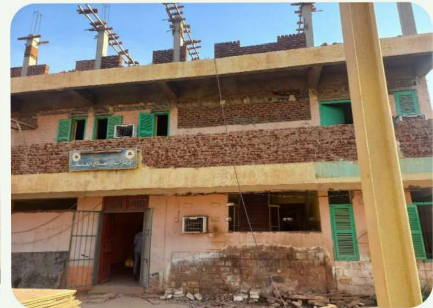
اعمال صب أعمدة الطابق الثاني