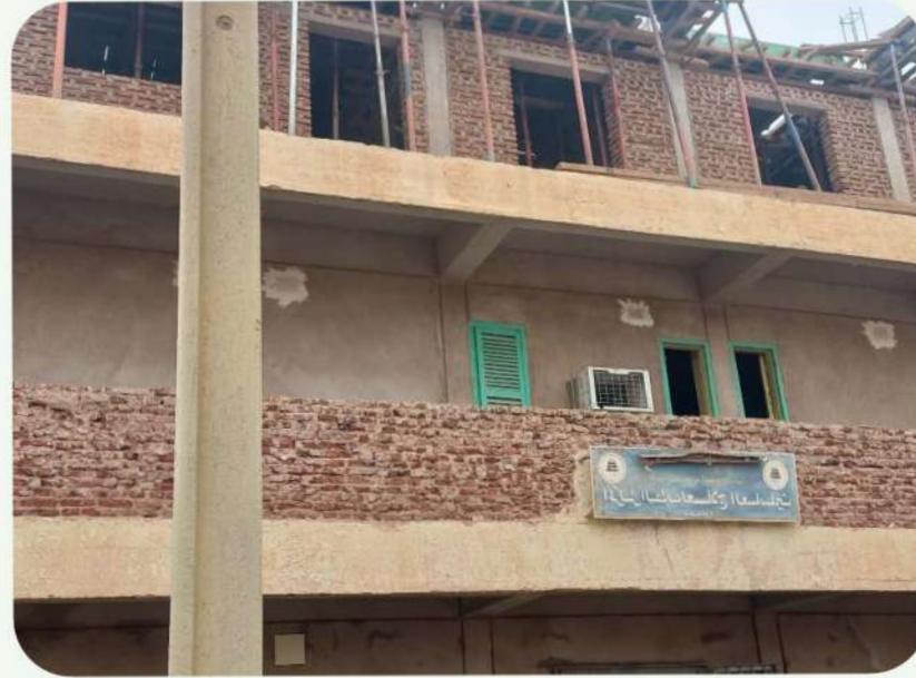
اعمال تقفيل مباني الطابق الثاني