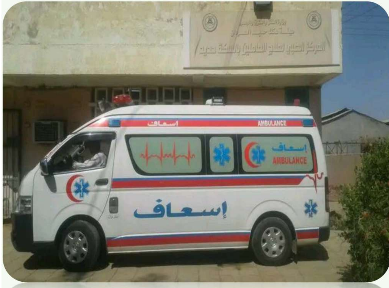
الإسعاف الجديد للمركز الطبي

المركز الطبي لعلاج العاملين بعطبرة: 3. يزور المركز عدد من الاختصاصيين لتقديم الخدمات الطبية علي مدار الاسبوع في التخصصات التالية : ▪ (باطنية - جراحة - أطفال - انف واذن وحنجرة - نساء وتوليد - جراحة - مسالك بولية) 4. يتردد علي المركز شهريا ما بين 1000 - 1500 مريض لتلقي العلاج.